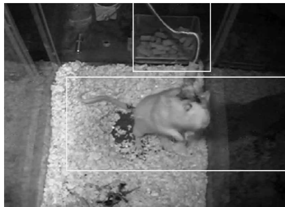
Рис. 4. Видеоизображение подопытного животного в боксе. Прямоугольниками обозначены боксы, соответствующие животному, а также кабелю, соединяющему вживлённые в голову животного электроды с передающим устройством.

Второе направление работ связано с проектами видеонаблюдения в биомедицинских экспериментах.