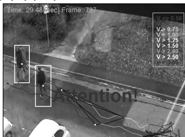
Рис. 2. Программа интеллектуального видеонаблюдения распознала уличный инцидент. Прямоугольниками обозначено текущее положение участников происшествия. Остальные обозначения такие же, как на рис. 1

ставление информации о движущихся объектах в виде термов (структур данных), а не фактов Пролога (логических формул). Логическая программа получает результаты низкоуровневого анализа видеозображения в виде структуры данных, описывающей набор связанных графов перемещений блобов. При этом каждый граф представлен в виде списка недоопределённых множеств [36], соответствующих отдельным рёбрам графа. Каждое ребро является направленным и снабжено следующими атрибутами: список номеров рёбер – непосредственных предшественников рассматриваемого ребра, список номеров рёбер – прямых продолжателей рассматриваемого ребра, координаты и скорость блоба в различные моменты времени, средняя скорость блоба на данном ребре графа и др.