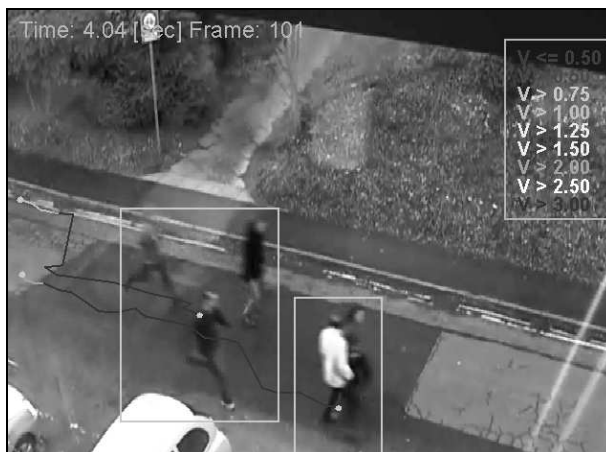
Рис. 1. В поле зрения программы интеллектуального видеонаблюдения попала ситуация, похожая на уличный инцидент (нападение группы хулиганов). Прямоугольниками обозначены движущиеся блобы, жирными линиями обозначены связанные графы перемещений блобов. Скорость движения блобов обозначена с помощью цвета рёбер графа

Рассмотрим пример анализа видеоданных из набора ВЕНАВЕ [41] (рис. 1). В соответствии с методом логического программирования систем интеллектуального видеонаблюдения, программа анализа создаёт несколько параллельных процессов.